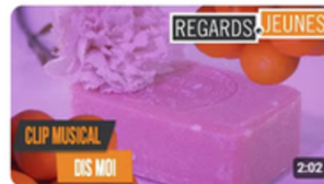
Clip Musical - Dis moi 64 vues • il y a 1 an