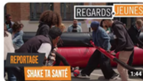
Reportage retour d'expérience | Just Make It 96 vues • il y a 10 mois