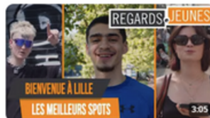
Bienvenue à Lille - Les meilleurs spots 194 vues • il y a 1 an