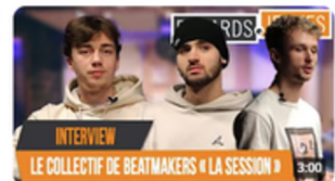
JFLMQMP | BEATMAKERS 50 vues • il y a 1 an