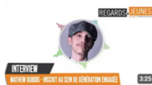
Podcast | Génération Engagée 45 vues • il y a 1 an