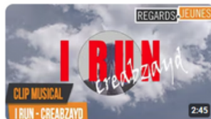
Clip Musical | I Run 84 vues • il y a 1 an