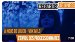
VOX MILO 2025 | L'Envoi Des Processionnaires 3,7 k vues • il y a 6 mois