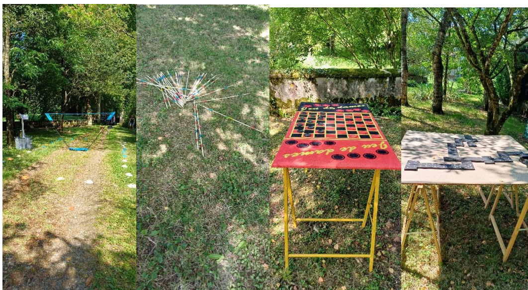
Espace jeux : badminton, jeux géants mikado, jeu de dames et dominos