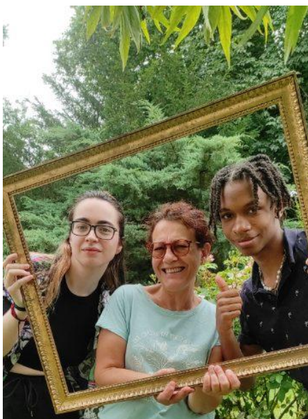
L'équipe MPEA-Green Mission 2