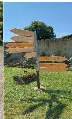
Accueil du public