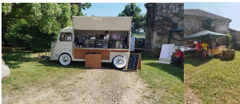
Food-truck et vente de produits locaux