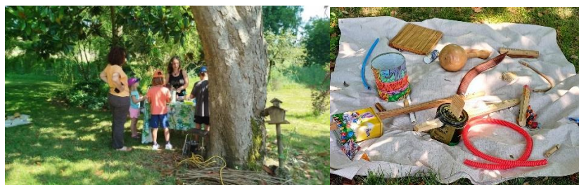
Fabrication d'instruments de musique avec Fabrik'Ecolozik