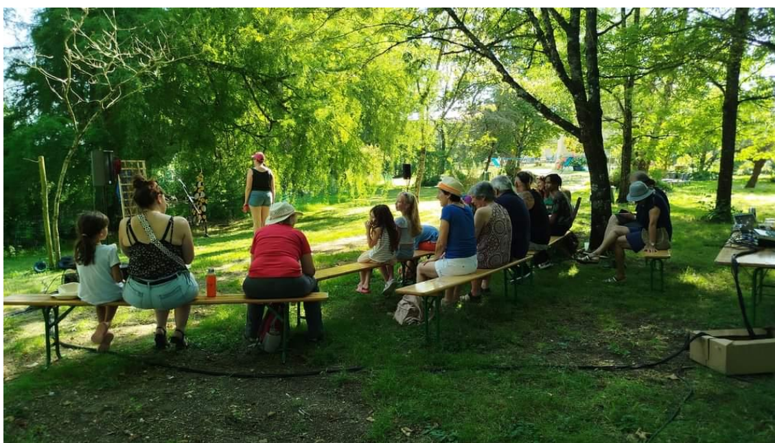
Spectacle « La gourmandise est dans les joues » par le collectif Nash